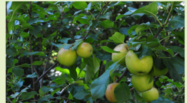
Tutte le immagini sono foto dei nostri lavori